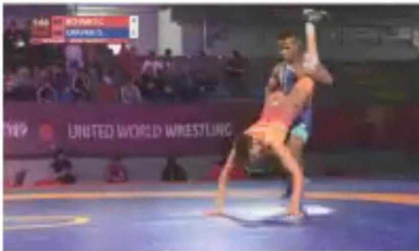
Action against joint (spine) Brutality

اگر مهاجم در حالت کنده افلاک مدافع را از تشک جدا و در اختیار داشته باشد: فقط حق دارد به طرفین فن خود را اجرا کند.